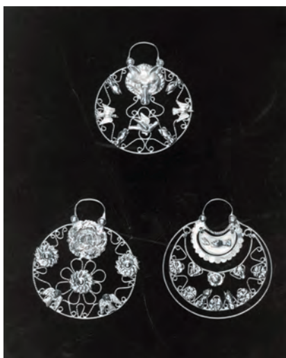
Tres ejemplos de arracadas de platería popular mexicana.