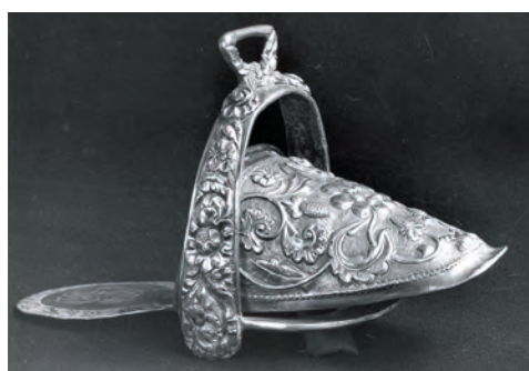
Estribo zapatilla peruana de plata labrada siglo XIX ref bib: 2344.

El banco de imágenes del Centro Rubín de la Borbolla cuenta con más de 24 000 imágenes de las cuales hasta el momento para el tema de la plata se encuentran clasificadas un poco más de 350 imágenes. En ellas destacan las colecciones de artesanos y talleres, las fotos de diferentes exposiciones realizadas en el Museo Nacional de Artes e Industrias Populares, las fotos de procesos y técnicas, de la obra de William Spratling y fotos del trabajo en plata de varios países sudamericanos, principalmente, Chile, Honduras, Perú y Colombia.