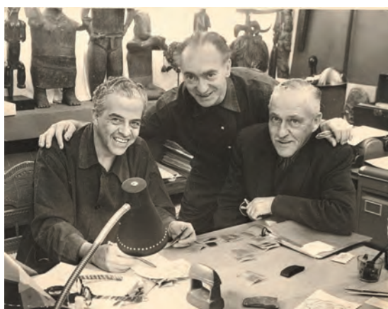
Retrato de William Spratling, Miguel Covarrubias y el fotógrafo Nickolas Muray.