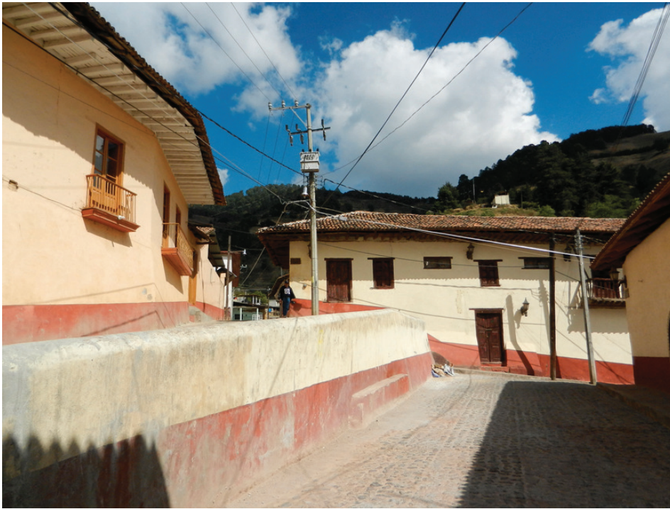
Arquitectura doméstica y calles adaptadas a la topografía del sitio en el centro de Angangueo.