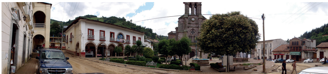
La Plaza principal es el centro geográfico, social y económico de Angangueo. En torno a este espacio urbano se concentran los inmuebles emblemáticos del poblado.

yacimientos hasta 1991, cuando cerró debido al bajo precio de la plata en los mercados nacional e internacional. 17