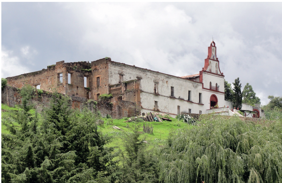
Hacienda agrícola Jesús Nazareno, se estableció en esta campiña al inicio del siglo XVII.

Pronto se fundaron otros socavones, como San Agustín, San Rafael y San Francisco, junto a los que se construyeron las primeras haciendas de beneficio. Estas actividades atrajeron gran cantidad de trabajadores, por lo que, al lado de las instalaciones mineras, en la parte más amplia de la cañada, surgió un caserío. 10