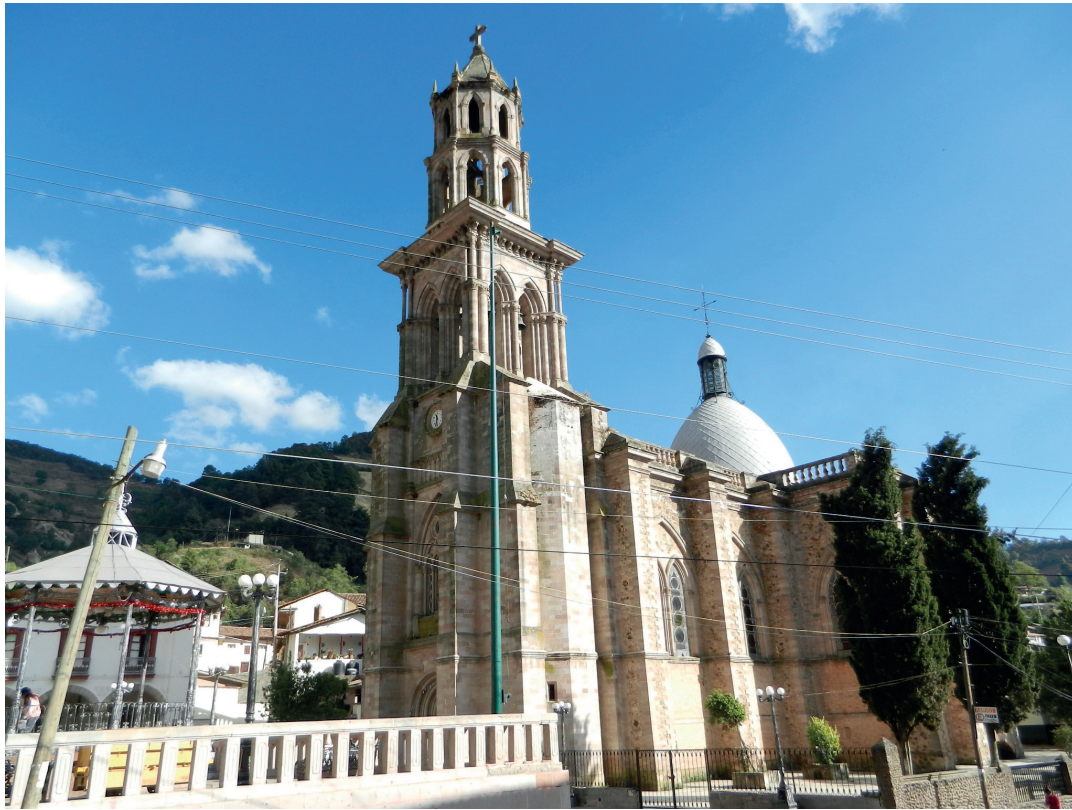
Templo de la Inmaculada Concepción se concluyó en 1882. Fue conocido como “la iglesia de los ricos”. Foto: Pablo Trujillo García, 2014