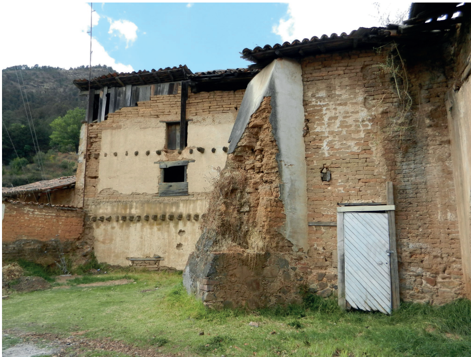
Aquí se aprecian los elementos y materiales con que se construyó la arquitectura doméstica de los habitantes de Angangueo, y que perduran hasta nuestros días. Foto: Pablo Trujillo García, 2014