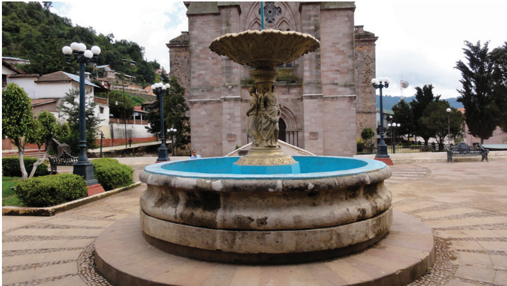
Fuente de “las tres gracias”, plaza principal de Anganguero. Foto: Pablo Trujillo García, 2010