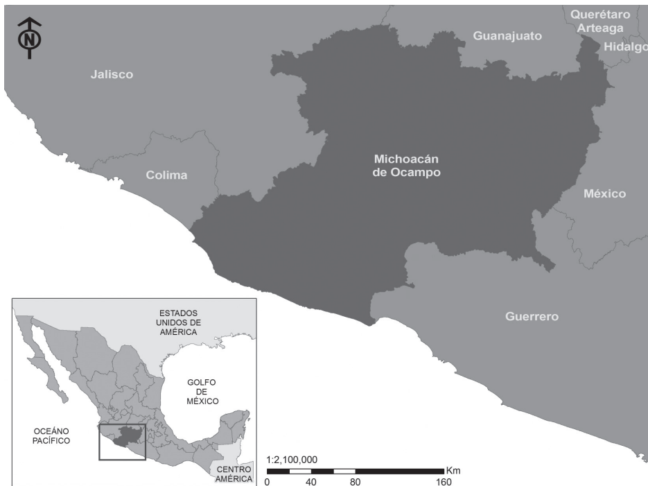
Ubicación del estado de Michoacán en la República mexicana. Elaboración del autor, digitalización Geog. Verónica Lerma. 2017