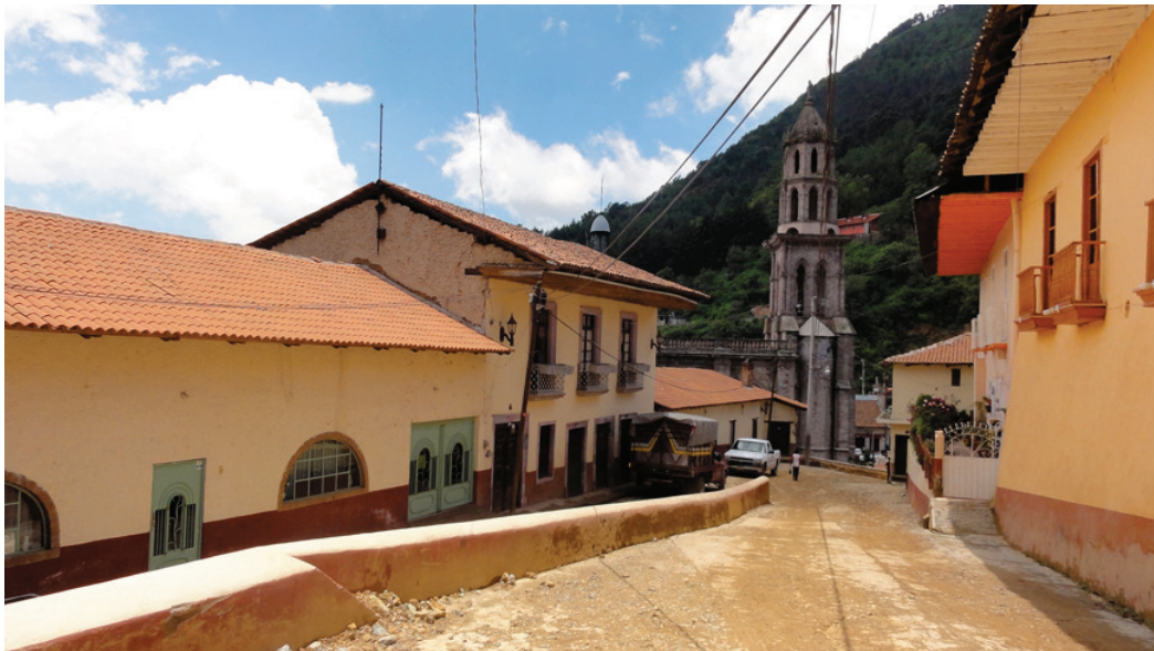
El perfil urbano generado por los volúmenes de las casas adaptadas perfectamente al emplazamiento.