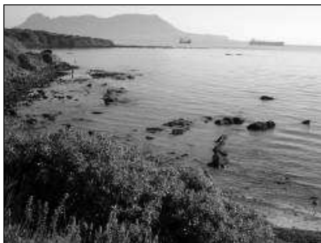
Figura 4.- Arrecifes de la Punta de San García desde Getares con Gibraltar al fondo.