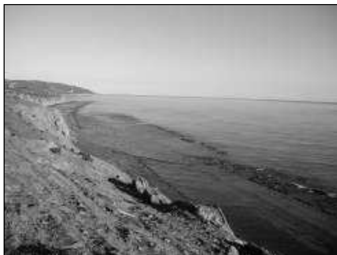
Figura 8.- Arrecifes o Paredones desde el camino de Tarifa con la torre de Guadalmecil y El Tolmo al fondo.