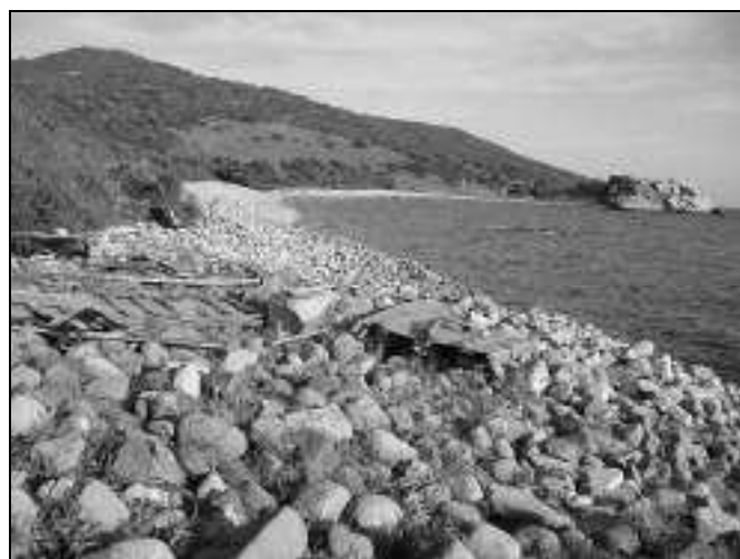
Figura 10.- Cala de Quebrantabotijas y punta del Tolmo.

Quebrantabotijas (Sáez, 1997, 146), topónimo algecireño que podría estar motivado por los restos de un alfar, y que es mencionado en el Poema de Alfonso Onceno (1991, 347) a propósito de la batalla del Salado, y en el Libro de montería de Alfonso XI (1983, 133) en “el camino de la playa que va de Algecira a Tarifa” (figura 10). En el límite tarifeño, otra playa próxima con algunas condiciones naturales para haber albergado una factoría de pescado es la desembocadura del