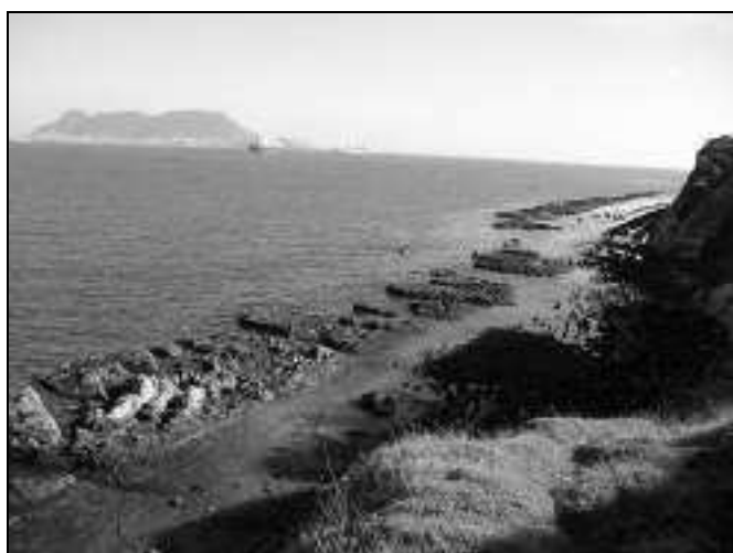
Figura 7.- Arrecifes cerca de La Ballenera.