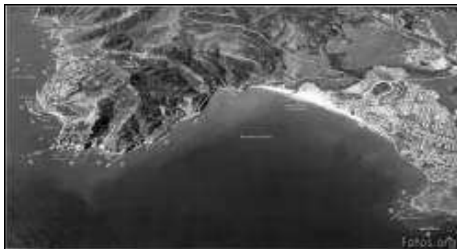
Figura 1.- Ensenada de Getares.

distinguir esta urbanización periférica de la pedanía de Getares situada más allá del faro de Punta Carnero en el extremo opuesto de la ensenada (figuras 1-2), o por contaminación con el nombre de Algeciras. Tampoco es probable que el sufijo colectivo -ares se hubiera aplicado en romandalusí al árabe šaṭ , ‘orilla’, étimo de Algete (Madrid) y tal vez de Jate y de Jete (Jiménez Mata, 1990, 55), e incluso de Gete (Burgos), de Gete y Getino (León) y de Jatíel (Teruel).