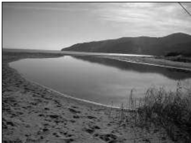
Figura 9.- Desembocadura del río Pícaro en la playa de Getares.

construcciones con restos cerámicos hallados en un cerro próximo a la desembocadura del río Pícaro (figura 9), y de otras piletas de opus signinum en lugares próximos y en el solar del Casino de Getares (Sedeño, 1986, 107; Vicente y Vicente, 2002, 493-494), que carecen de un estudio y valoración (Bernal, 2003, 165).