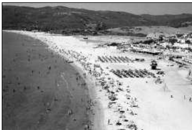
Figura 2.- Playa de Getares hacia el Sur.

Por tanto, los *satares o *setares debían de designar varios grupos de algo pronunciado hacia el siglo VII /sata/ , /satu/ , /seta/ o /setu/ . De sectum (‘cortado’), que podría aludir a un acantilado, esperaríamos otros resultados en el grupo /ct/ (Galmés, 1995, 730), y el significado de otras formas como sata (‘mieses’ o ‘sembrados’) no cuadra con las características del lugar ni con el valor del sufijo. Los étimos más probables son pues saeta , ‘cerda’, el pelo grueso y rígido de animal y la hoja o ‘aguja’ de coníferas (PLIN. 10,18), y en sentido figurado una ‘caña’ de pescar (MART. 1,56) y un ‘cepillo de cerdas’ para enlucir paredes con cera púnica (PLIN. 33,7,40; VITR. 7,9); o bien saeptum (‘seto’, ‘corral’, ‘cercado’, ‘vallado’), que también podría ser el étimo de alguno de los topónimos anteriores asociados a šaṭ . En Getares podría referirse al ‘corral’ o ‘vivero’ de peces. COL. 8,17: Frequenter animadvertimus intra septa pelagios greges inertis mugilis et rapacis lupi . “Vemos muchas veces dentro de los corrales los bancos marinos del tranquilo mújol y de la lisa voraz.” Estos corrales, en uso en la