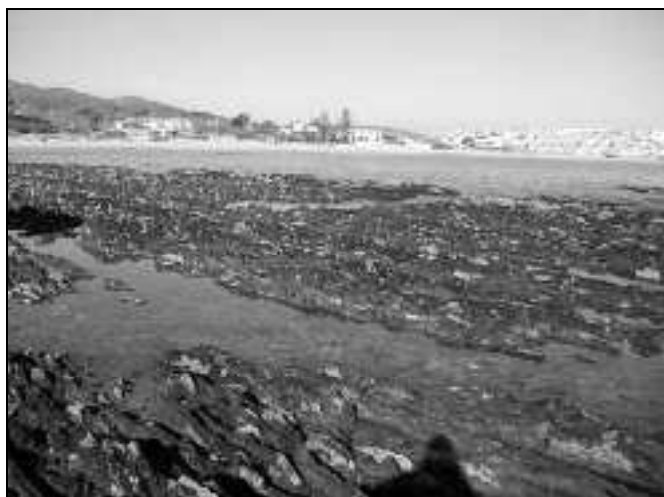
Figura 5.- Arrecifes en la punta sur de Getares.