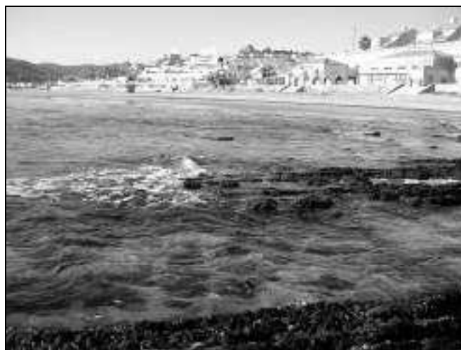
Figura 3.- Arrecifes y últimas viviendas de Algeciras en la playa de Getares.

costa atlántica gaditana desde la Antigüedad hasta el siglo XIX (Moreno y Abad, 1991), podían excavar en la roca o fabricarse con opus signinum en la playa, y permitían capturar con marea baja morenas, mújoles, lizas o lisas, róbalos de mar y otros peces que entraban en ellos con la marea alta. En Getares, los arrecifes naturales de roca como los que hoy vemos en la playa (figura 3), en la punta de San García donde sirvieron de cantera (figura 4), o en la Punta del Carnero (figura 5) cerca del faro (figura 6) y de la factoría de La Ballenera Española en uso hasta mediados del siglo pasado (figura 7), pudieron parecer una serie de corrales de pesca naturales o arruinados y ser designados con ese nombre. Es lo que sucedió luego, entre otros lugares de este litoral (Cestino, 2004, 53-55), con los arrecifes naturales de Punta Paloma o de los Corrales (Fernández-Palacios y Gil, 1988, 177), usados también como cantera y llamados Villavieja porque antes fueron interpretados como una ciudad sumergida e identificada con Mellaria (Gutiérrez, 1771, 186, 206 y 225), y con los de Los Parentones o supuestos paredones de edificios arruinados entre Tarifa y la torre del Guadalmequí (figura 8).