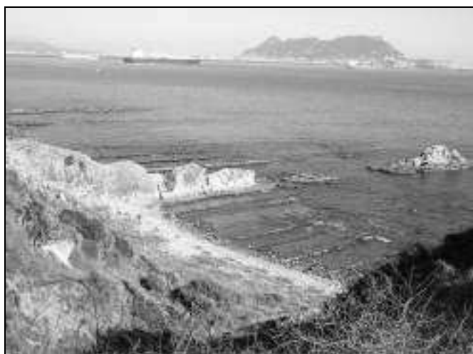
Figura 6.- Arrecifes desde el faro de Punta del Carnero con Gibraltar al fondo.