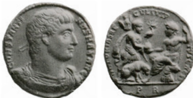
Figura 2. Medallón de bronce. RIC VII 279. Año 332. Constantino con diadema con camafeos y perlas.