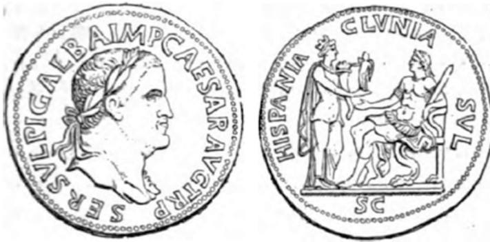
Figura 13. RIC 472. H. COHEN, Fuente: H. COHEN, Description historique des monnaies frappées sous l'Empire romain, communément appellées médailles impériales , vol. I, Paris, 1880, N° 86, p. 325.