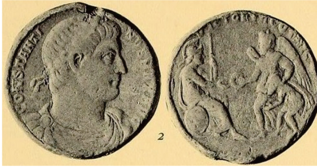
Figura 3. Medallón de bronce. RIC VII 306. Año 332.

principi y mostraban una imagen similar 28 . Por su similitud con los tipos de Trajano, la acuñación de Constantino con la leyenda continua tuvo que ser la primera, del año 332. La pieza que lleva la leyenda partida por la cabeza del emperador, parece tener una peor labra, lo que permite deducir que fue batida posteriormente, siendo imposible determinar si fue en 332 o un año después.