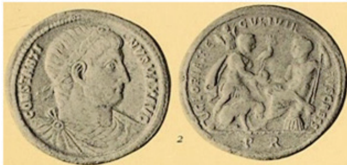
Figura 1. Medallón de bronce. RIC VII 279. Año 329. Constantino con diadema laureada.

329 18 . La victoria de 328, que no se saldó con un definitivo sometimiento de los godos, era una razón suficiente para que fuera recordada con una acuñación de medallones. No obstante, la inversión que había realizado Constantino fue ingente, ya que tuvo que levantar un puente sobre el Danubio entre la ciudad fronteriza de Oescus y Sucidava, al otro lado del río 19 .