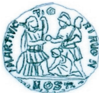
Figura 10. Follis de Majencio. Cayón Nº 85. Año 311. Dibujo del autor