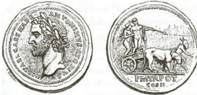
Figura 8. Gnecci 101.

Bryce y Lecocq han tratado de explicar la presencia del ave Fénix apoyándose en el poema De aue Phoenix , atribuido por algunos autores a Lactancio, como un emblema de la periódica restauración del Imperio. Sin embargo, es difícil sostener que