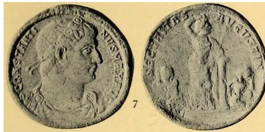
Figura 7. Medallón de bronce. RIC Rom. 299-Cayón N° 275. Año 334.