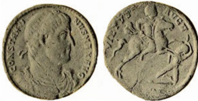
Figura 4. Medallón de bronce. RIC 309-Cayón 287. Año 332 ó 333.

La medalla con la leyenda Salus rei p(ublicae) se ha datado en 328. Representa el paso de Constantino, precedido de Victoria, sobre el puente que unía ambas orillas del Danubio, personificado como un anciano recostado e identificado con la inscripción Danubius (figura 5) 29 . Sin embargo, todo parece indicar que la moneda con la leyenda conmemoraba la victoria de 332, y no la construcción del puente, de modo que no puede ser de 328, sino cuatro años posterior. Por otra parte, la representación en el anverso de Constantino con diadema perlada impide datar esta pieza antes de 330. La imagen recuerda uno de los paneles narrativos del arco de Constantino, en