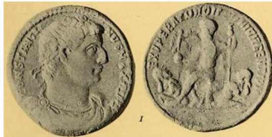
Figura 6. Medallón de bronce. RIC Rom. 296-Cayón 266. Año 334. Fuente: F. GNECCHI, I medaglioni... , lám. 130, fig. 1.