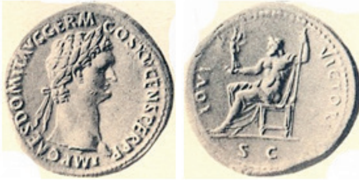
Figura 12. As de Vespasiano.