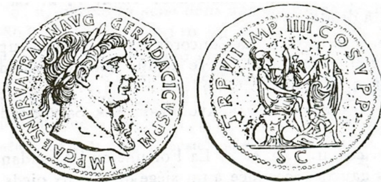
Figura 14. RIC 451.