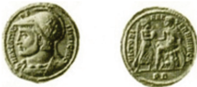
Figura 9. Áureo de Majencio. RIC Rom. 152-R4. Año 307. J. R. CAYÓN FERNÁNDEZ, Compendio... , p. 1991 (Nº 32).

la iconografía se inspire en el rétor cristiano, fundamentalmente porque es muy cuestionable que De ave Phoenix sea una de sus obras. Los estudios lexicográficos de Richter y Sarzetto datan la composición en época valentiniana 47 . Además, la ambigüedad religiosa del texto poético no parece coincidir con los acentos polémicos de las Diuinae institutiones , tratado en el que ni siquiera es mencionado el Fénix. Su prestigio como escritor cristiano hizo que en la Edad Media se creyera que era el autor de obras que no eran suyas 48 . Estas observaciones son suficientes para considerar necesaria la búsqueda de otras explicaciones de la iconografía del medallón constantiniano.