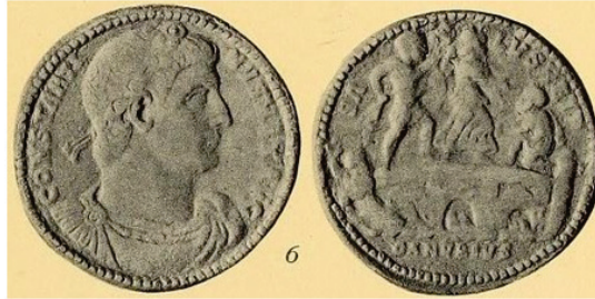
Figura 5. Medallón de bronce. Cohen N° 483-Cayón N° 274. Año 332. Fuente: F. GNECCHI, I medaglioni... , II, lám. 130, fig. 6.

el que Roma y la Victoria guían a sus tropas cuando atravessaban en formación de cuña el Puente Milvio, abriéndose paso entre los soldados de Majencio 30 .