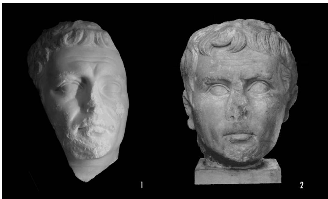
Figura 5. Retratos de Augusto de época claudiana. 1. Retrato de Santacara. 2. Retrato de Eauze del Museo de Saint-Raymond de Toulouse (Rosso 2006: 210).

1990: 54, n.º 150; Boschung 1993a, 190, n.º 198). El objetivo de esta serie de retratos del Diuus Augustus , representados con los rasgos estilísticos propios de la iconografía del emperador Claudio, no es otro que vincular la imagen del emperador con el creador de la dinastía y presentarse de este modo como su heredero directo. Esto se enmarca directamente con la forma que el propio Claudio llegó al trono imperial (Suet. Claud. 5. 10; Dio. 60. 1).