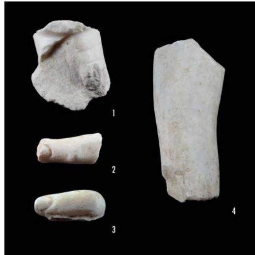
Figura 3. Otros restos de estatuaria en mármol blanco de la zona A: 1. Fragmento de cuello. 2-3. Fragmentos de dedos. 4. Fragmento de brazo.

lugar en el que se conservan los posibles restos del pórtico. Las dos laterales, en los lados este y oeste, son de unos 2 m de anchura. En la zona también aparecieron dos capiteles corintios de pilastra –dados en época augustea– que se exhiben en el Museo de Navarra (Gutiérrez Behemerid 1992: 79-80, n.º 206-209; Mezquíriz 2006: 177, n.º 6) y un tercero –de idénticas características tipológicas– que se conserva reutilizado en una vivienda de la actual Santacara.