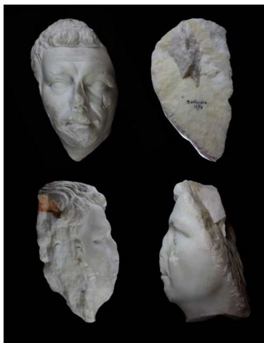
Figura 1. Diversas vistas del retrato de Augusto de Santacara.

365-388) están ampliando de manera significativa los programas estatuarios en mármol de esta parte del conventus Caesaraugustanus y llamando, también, la atención sobre la conexión oficial temprana de la mayor parte de las ciudades de dicho ámbito en general (García Vi-