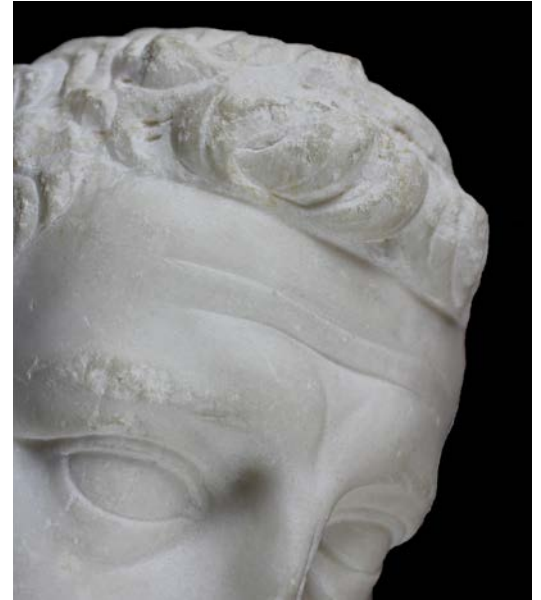
Figura 4. Detalle de los trabajos de reelaboración del retrato en la frente.

El retrato representa a un personaje masculino de edad madura, según se desprende de sendas arrugas horizontales presentes en la frente. La escala de la imagen es un poco mayor que al natural. Los ojos son grandes, alargados y están hundidos y rodeados por un anillo ancho. Las cejas gozan de una curvatu-