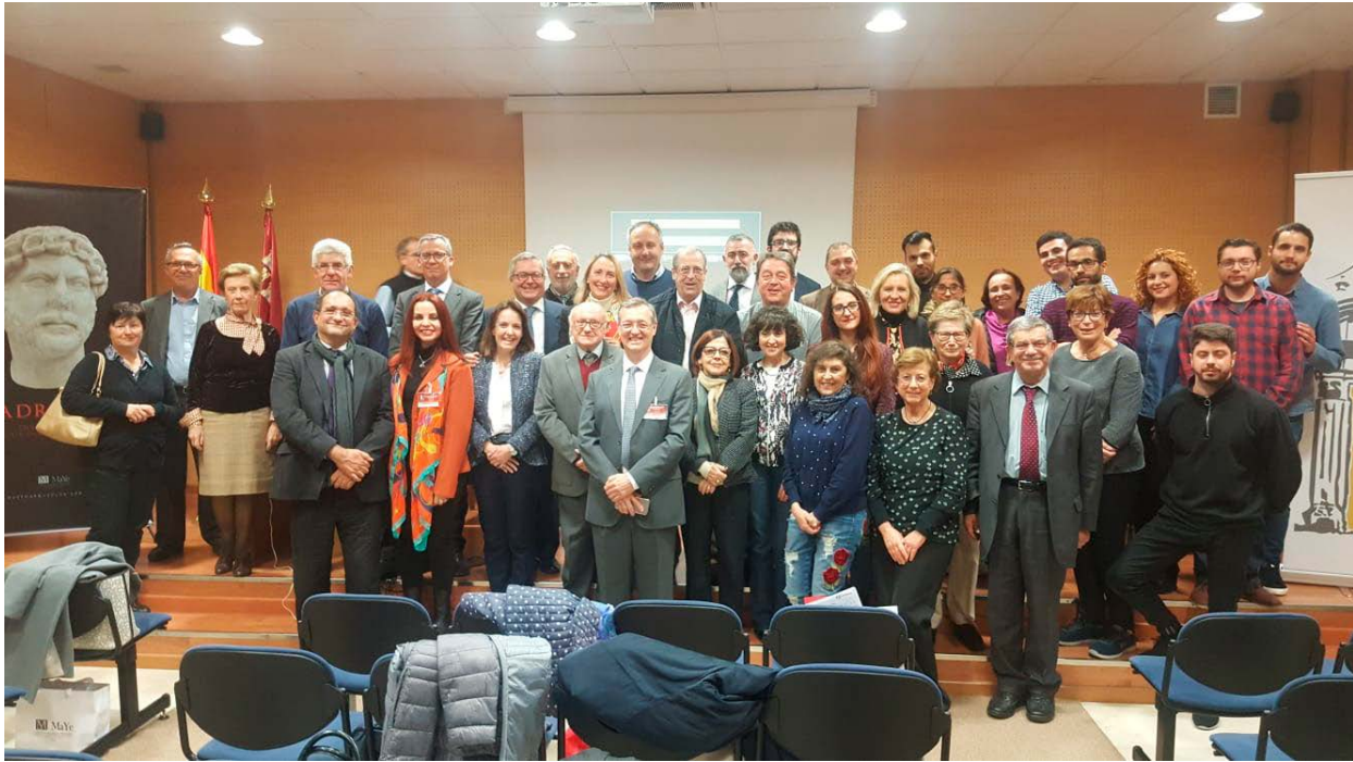
Foto de grupo de los participantes en la IX Reunión internacional sobre Escultura Romana en Hispania , celebrada en el Museo Arqueológico Municipal “Cayetano de Mergelina” de Yecla del 27 al 29 de marzo de 2019.