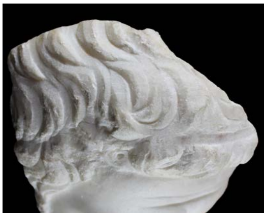
Figura 6. Detalle del rebaje y huellas de anclaje para corona metálica.