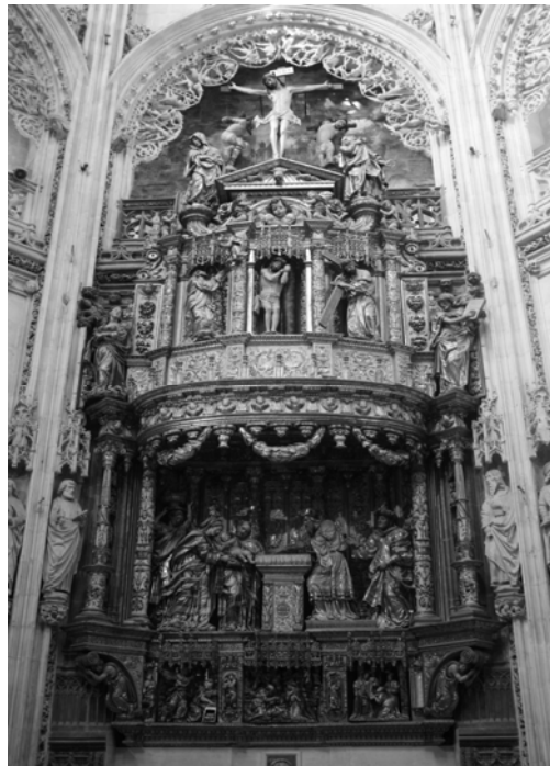
Fig. 8. Retablo mayor de la capilla de la Purificación. Diego de Siloé y Felipe Bigarny. Catedral. Burgos.