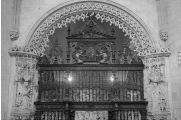
Fig. 6. Reja de la capilla de la Purificación. Cristóbal de Andino. Catedral. Burgos.