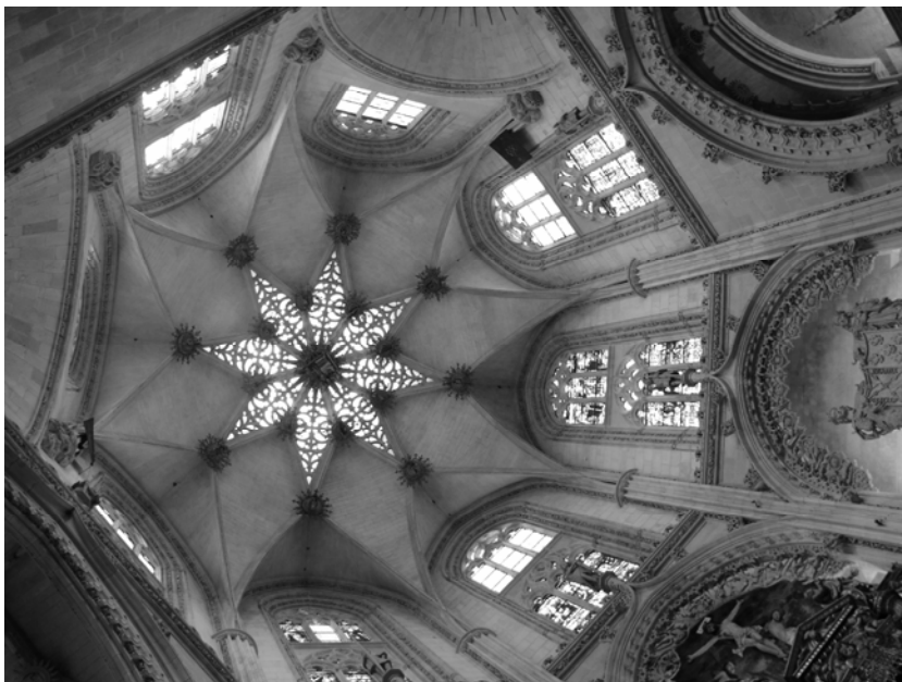
Fig. 3. Bóveda calada de la capilla de la Purificación. Catedral. Burgos.