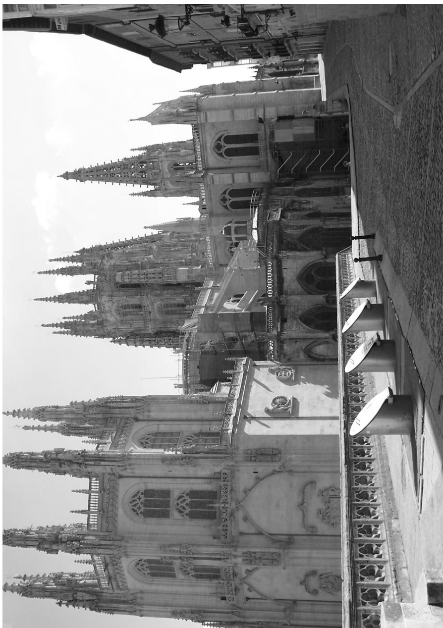
Fig. 1. Vista exterior de la Capilla de la Purificación. Catedral. Burgos.