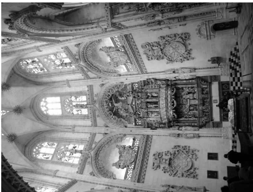
Fig. 2. Vista interior de la Capilla de la Purificación. Catedral. Burgos.