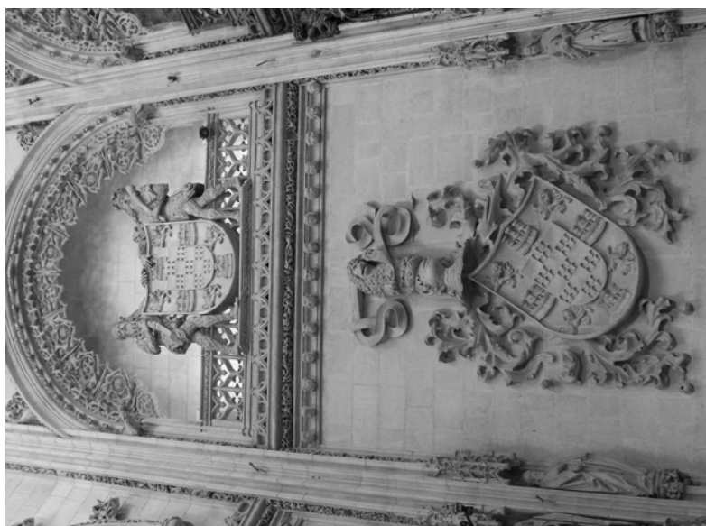
Fig. 4. Escudos de los Fernández de Velasco. Capilla de la Purificación. Catedral. Burgos.