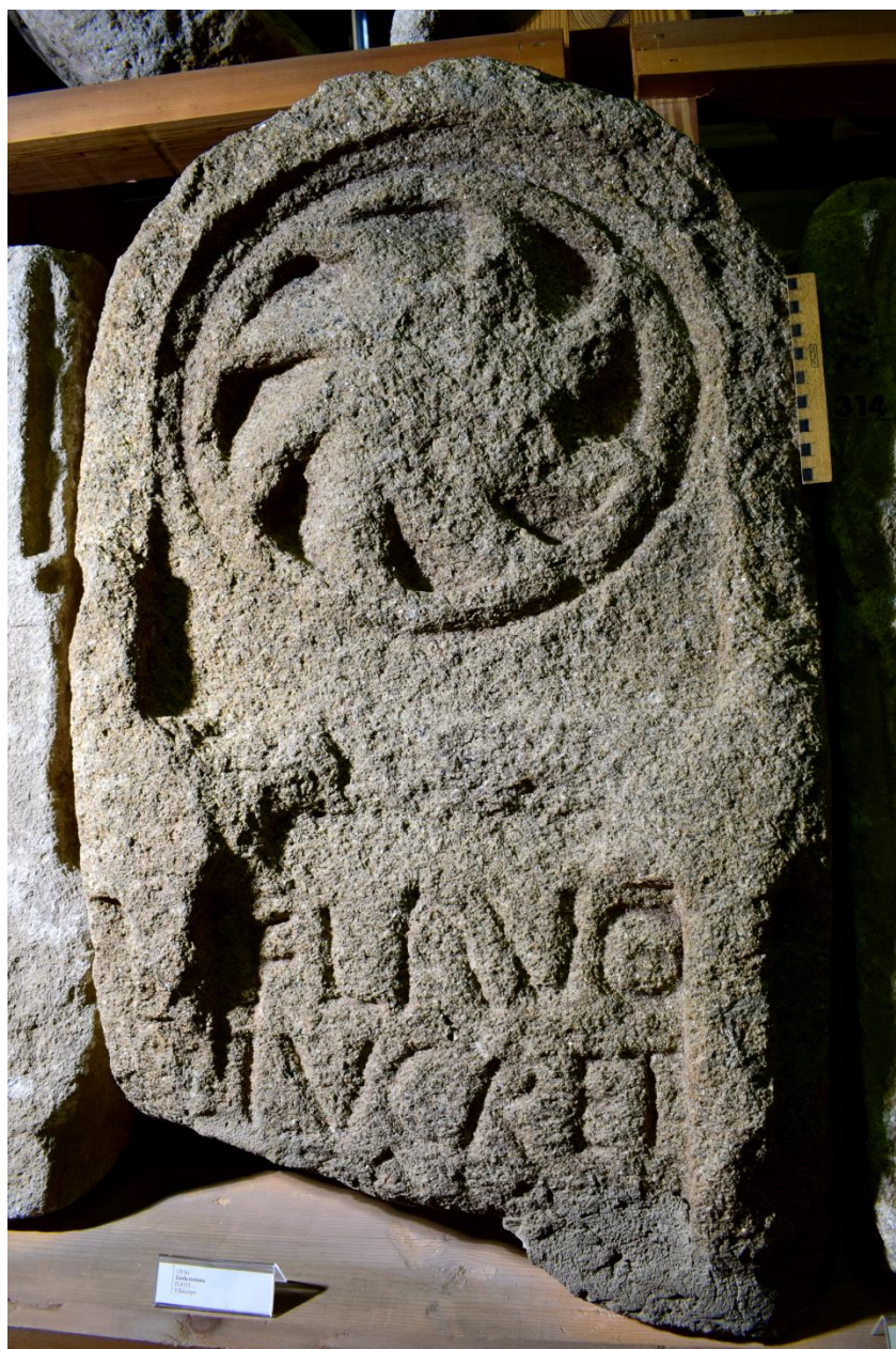
Figura 8. Estela de Flavus en Villalcampo (Zamora). Museo de Zamora.

La particular historia del conjunto epigráfico de Villalcampo hizo que algunas de las estelas recuperadas en 1953 llegaran al Museo de Zamora con fracturas superiores e inferiores de cierta consideración. Es el caso de la estela de Flavus que nos ocupa 29 . El monumento es un ejemplar de granito, con las mismas características técnicas que varias de las piezas de este grupo, y presenta una fractura inferior que ha hecho perderse incluso una parte del campo epigráfico, donde es fácil que incluso haya desaparecido alguna línea. La estela presenta cabecera semicircular decorada con una roseta de ocho radios curvos dentro de una cartela