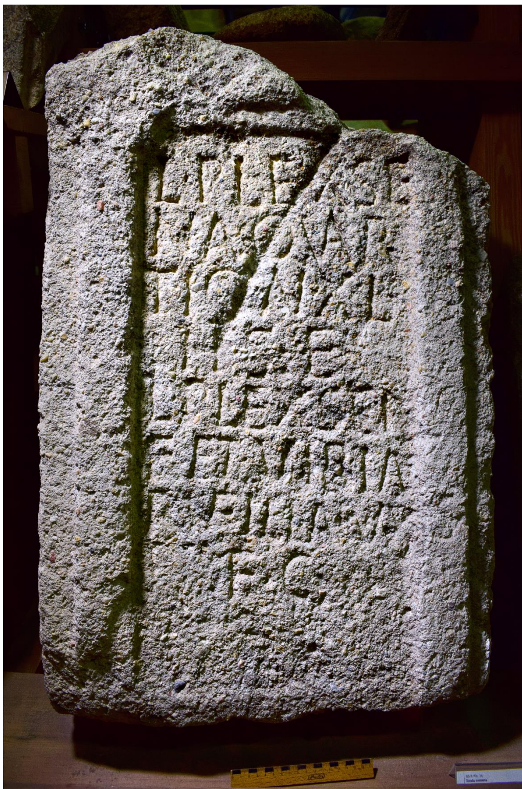
Figura 10. Estela de L. Plexsena Quartio en Villalazán (Zamora). Museo de Zamora.