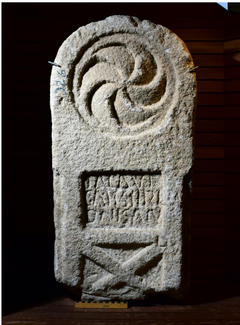
Figura 6. Estela de Villalcampo (Zamora). Museo de Zamora.