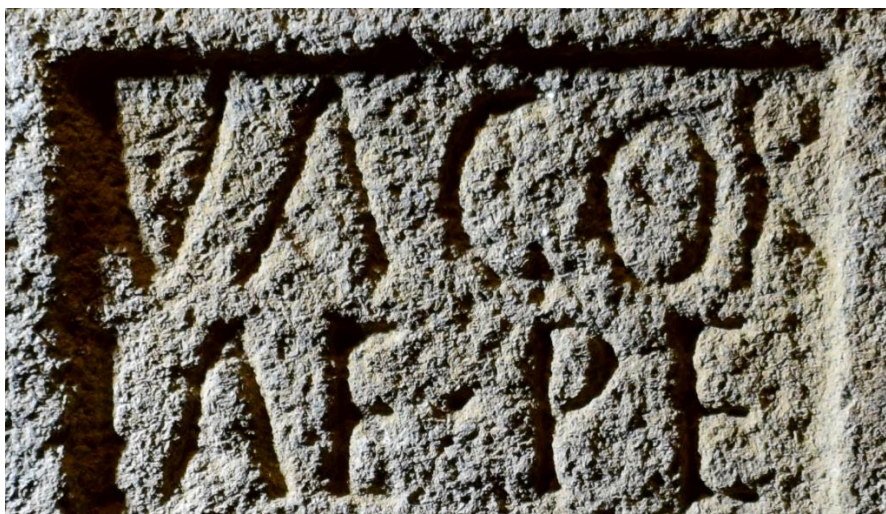
Figura 5. Detalle de las dos primeras líneas de la estela de Vagoria en Villalcampo (Zamora). Museo de Zamora.

El texto es de una extraordinaria sencillez y lo más destacable en él es la forma de la segunda consonante de la primera línea, que no es una C sino una G con el trazo recto inferior en posición oblicua (Figura 5), de manera muy similar al testimonio de Gudia ya citado. Aunque no se puede excluir que existiera una grafía equivalente a la pronunciación Vacoria , lo cierto es que este único testimonio de este nombre seguramente indígena dice Vagoria y no Vacoria .