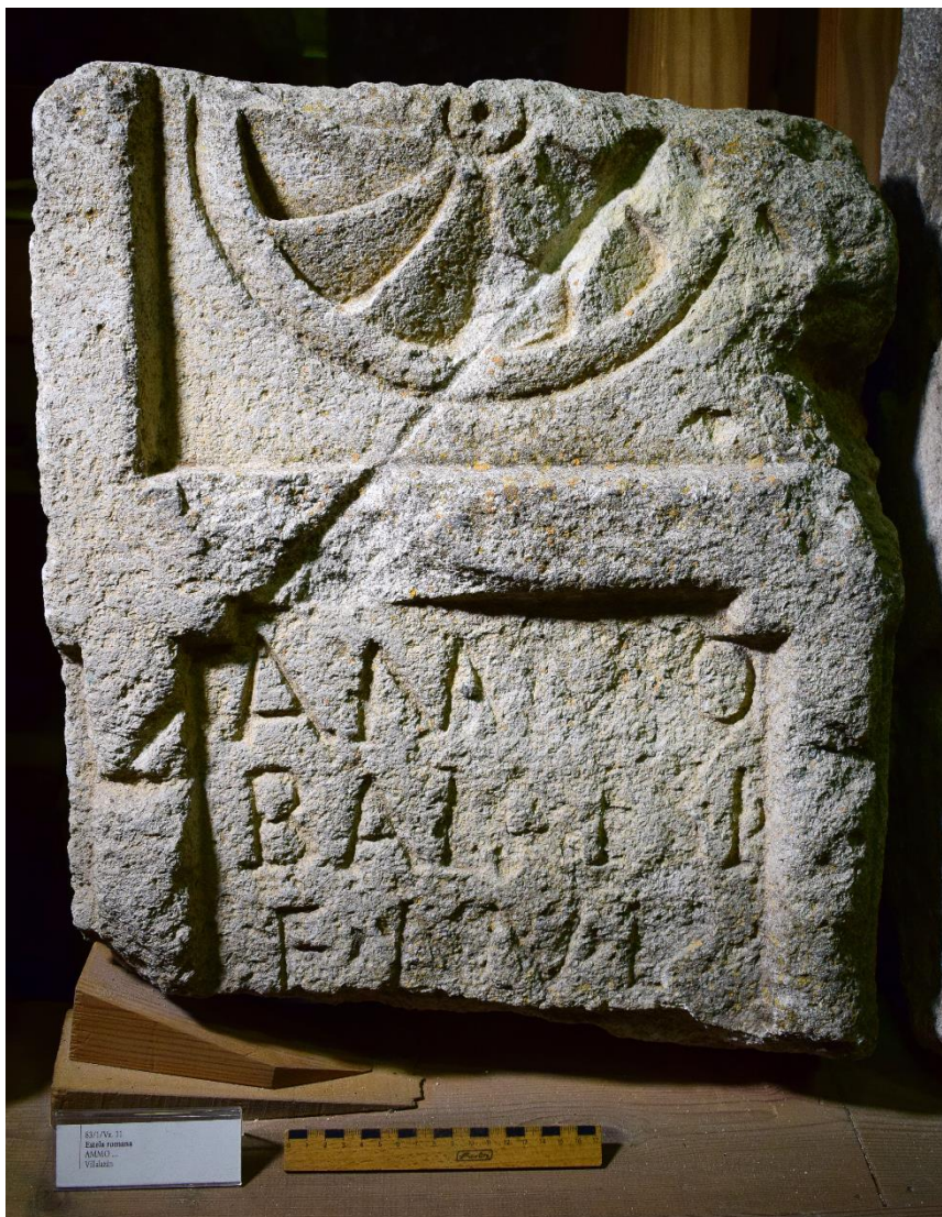
Figura 9. Estela de Ammo en Villalazán (Zamora). Museo de Zamora.

del texto, flanqueada por pilastras y que conserva una superficie de (25) x 31 cm. La altura de las letras es de 6 cm en el primer renglón y de 5,5 cm en los dos siguientes. Las interpunciones tienen forma de virgulae .