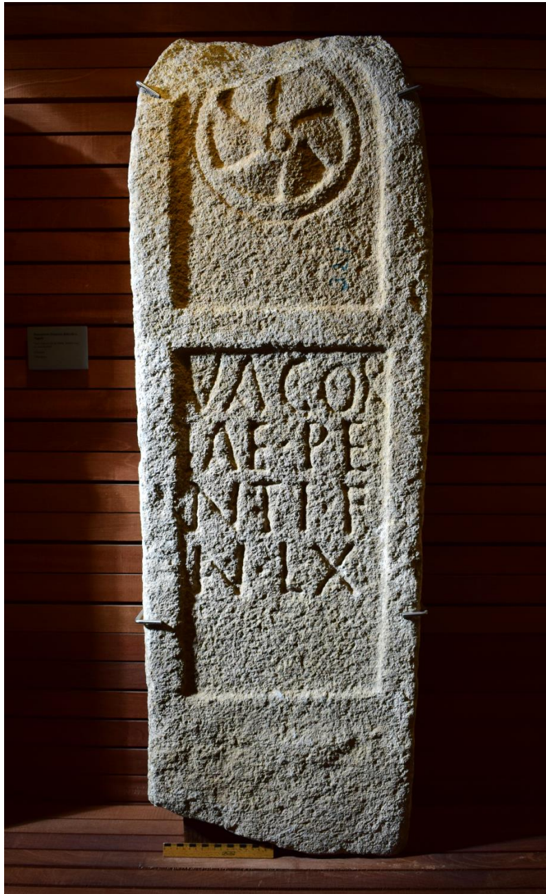
Figura 4. Estela de Villalcampo (Zamora). Museo de Zamora.

Otra de las correcciones onomásticas necesarias en la provincia de Zamora nos lleva ahora a una estela funeraria muy sencilla 14 y bien conservada que, como otras muchas que alberga el Museo de Zamora, fue recuperada en el Castro de Santiago durante las obras de construcción del embalse y central eléctrica de Villalcampo en 1953, según sabemos por las crónicas de F. Diegos Santos y V. Velasco Rodríguez, a quien hay que atribuir el mérito de que estas piezas no se perdieran.