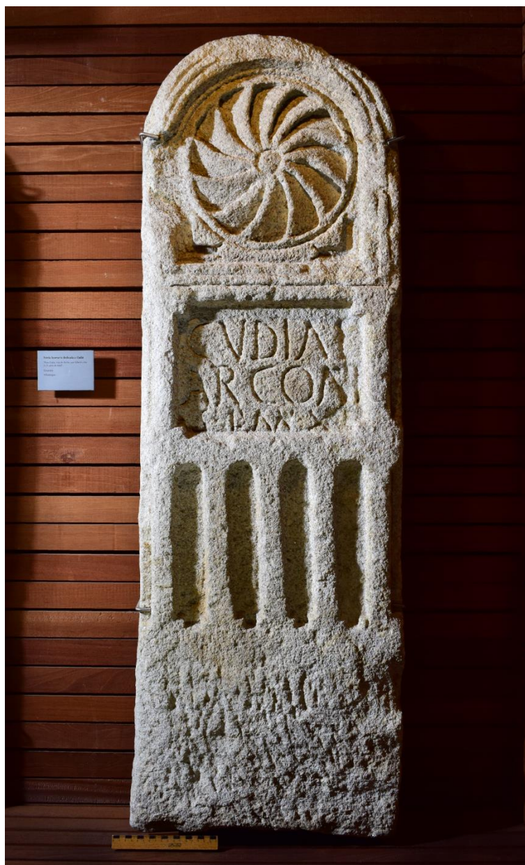
Figura 1. Estela de Villardiegua de la Ribera (Zamora). Museo de Zamora.

El Museo de Zamora conserva una conocida estela procedente de Villardiegua de la Ribera (Zamora) 4 , al sur del río Duero y, por tanto, en el conventus Emeritensis , que a priori no plantea problemas de lectura pero que merece una detenida revisión.