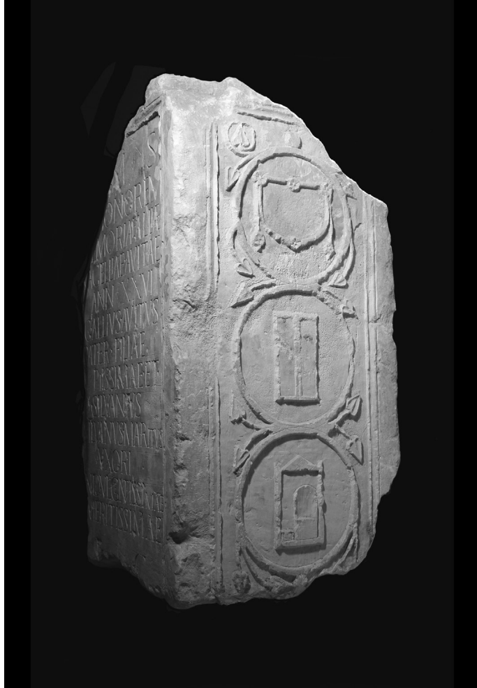
FIG. 3 – Cipo prismático de Allia Vagellia Auita.