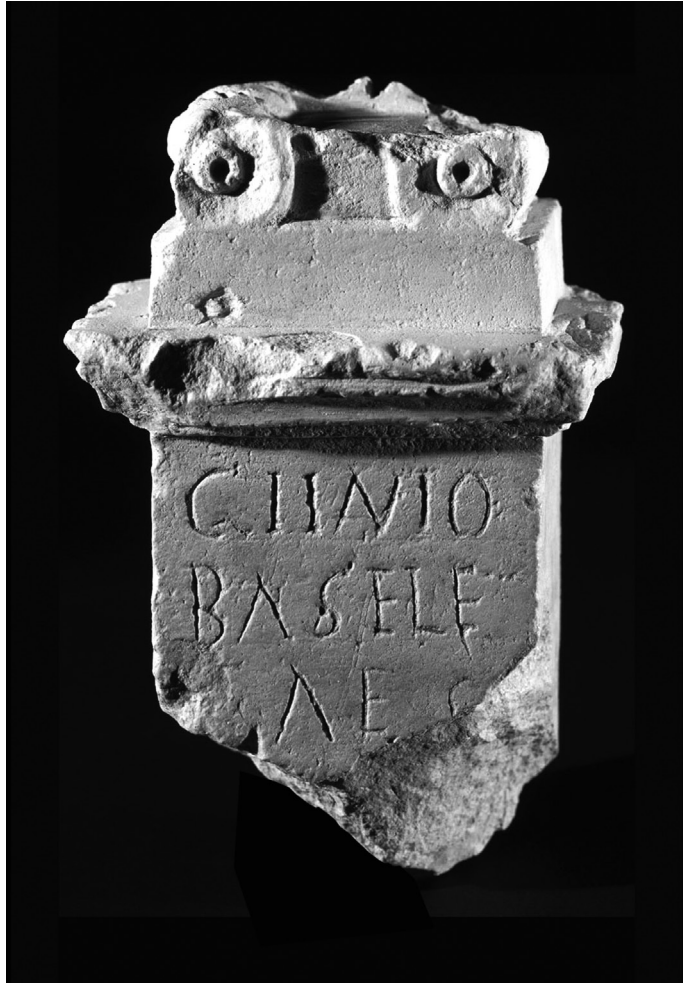
FIG. 2 – Árula ao génio da basílica (apud Alarcão et alii 2009, 66, fig. 43).