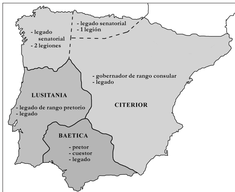
Figura 1. Circunscripciones administrativas y militares de Hispania según Estrabón.

La situación descrita por Estrabón 9 corresponde a un momento posterior al año 19 a.C., pues el territorio que había sido escenario de las Guerras