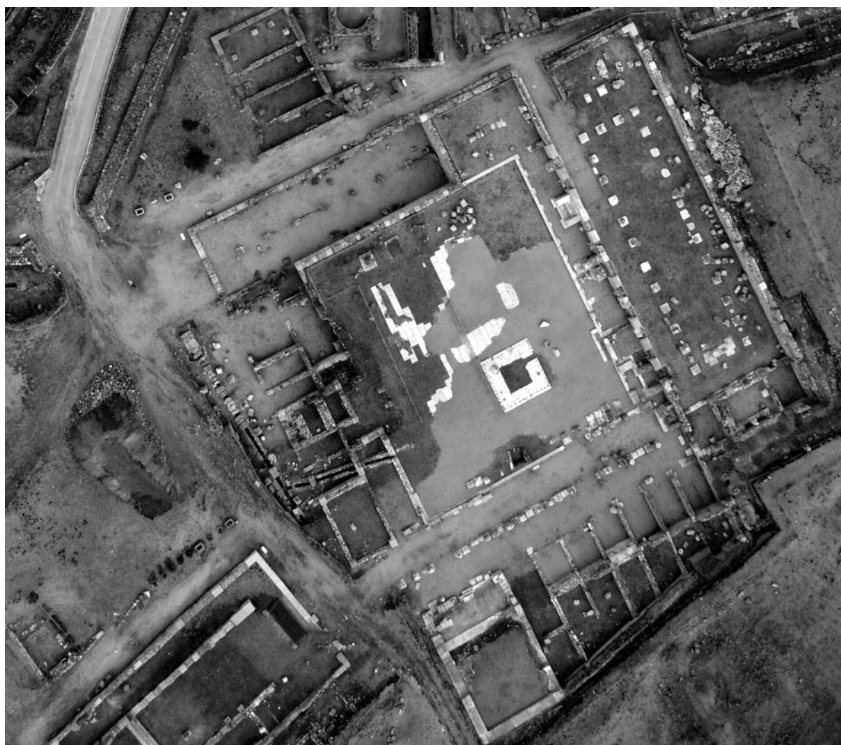
Fig. 2. Vista aérea del foro y de la basílica de Segobriga.

En época augustea, la ciudad se dotó de una muralla de unos 1.300 m de longitud y se llevó a cabo la construcción del foro, con una extensión aproximada de 1.278,3 m 2 (Fig. 2). Tanto la plaza como el pórtico meridional de ésta estuvieron decorados con numerosos pedestales epigráficos, algunos de los cuales subsisten in situ , y con un rico programa escultórico público y privado, que incluye