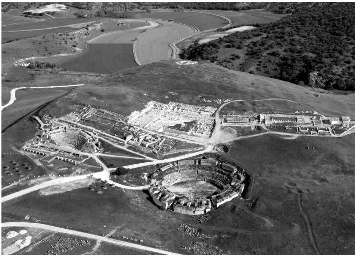
Fig. 1. Vista general de Segobriga desde el noroeste, con el anfiteatro en primer plano.