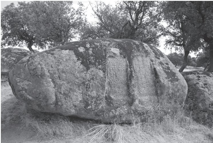
Figura 3. Inscripciones funerarias rupestres de Malamoneda (Hontanar, Toledo).

hija de Caecilius Severinus , fallecida a los 15 años de edad; el de la derecha es el de su padre 9 . Aunque a primera vista podría tratarse del testimonio de una muerte accidental de ambos personajes en medio del campo, la existencia de fosas similares en los afloramientos de granito que rodean este monumento permite afirmar sin dudas que estamos dentro de una necrópolis romana de cierta envergadura. A ello hay que añadir algunas evidencias de epigrafía romana exenta que han sido recogidas en este ámbito en las últimas décadas.