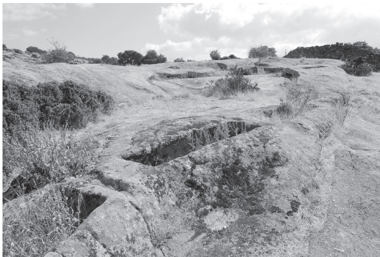
Figura 2. Tumbas excavadas en el granito en la necrópolis romana de Malamoneda (Hontanar, Toledo).

tos con los nombres de Malamoneda y Buenamoneda 7 . La extensión de los testimonios funerarios apunta a la existencia aquí de una entidad urbana romana de medianas dimensiones, lo que dio lugar desde el siglo XVI a reiterados intentos de probar la antigüedad del lugar aun a costa de inventar inscripciones. Huelga advertir que son escandalosamente falsos los dos epígrafes 8 inventados por Román de la Higuera para probar que este lugar constituyó en el pasado la respublica Monetensis , pues forman parte de un numeroso repertorio creado sobre todo por los anticuarios anteriores a la Ilustración para adaptar la historia a sus caprichos intelectuales.